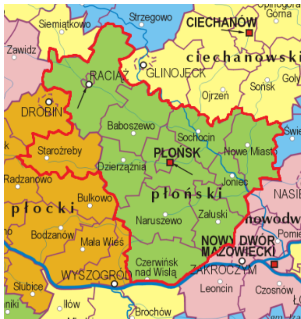
Rys 1. Obszar LGD-PM na tle mapy administracyjnej.

Obszar LGD nie obejmuje gminy miejskiej Płońsk, która ze względu na przekroczenie 20 tys. mieszkańców, nie mogła zostać objęta Lokalną Strategią Rozwoju (zwaną dalej LSR). Wszystkie miejscowości obszaru LGD-PM mają mniej niż 5 tys. mieszkańców.